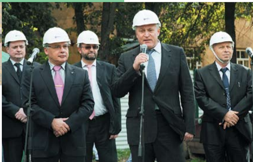
Всего в 2011 году в Ленинском районе будет введено более 400 тысяч м 2 нового жилья.