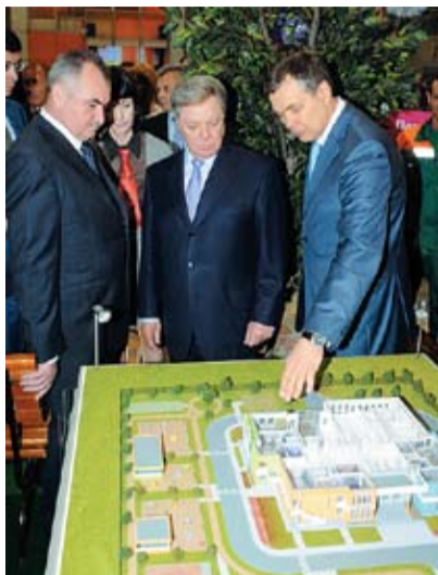
Выставка «Строительная неделя Подмосковья — 2011»

— Я надеюсь, что застройщики, инвестиционные компании, главные